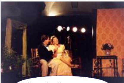
Filosofo di campagna