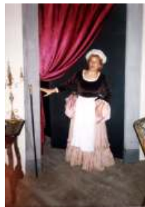
Il Barbiere di Siviglia

Selezione di pagine significative tratte da alcune fra le più belle opere liriche, viene eseguita in costume per soli, coro e pianoforte.